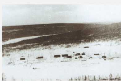
Туринская культбаза, 1927 год.