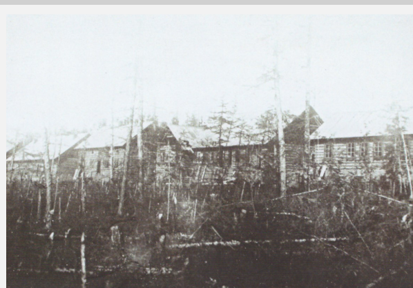
Первая очередь стройки Эвенкийской культбазы. Слева направо: больница, жилой дом для персонала, баня-прачечная, ветеринарно-бактериологическая лаборатория, дом для приезжих эвенков, газовая камера для лечения чесоточных оленей, ледник-подвал. Лето, 1927 год.