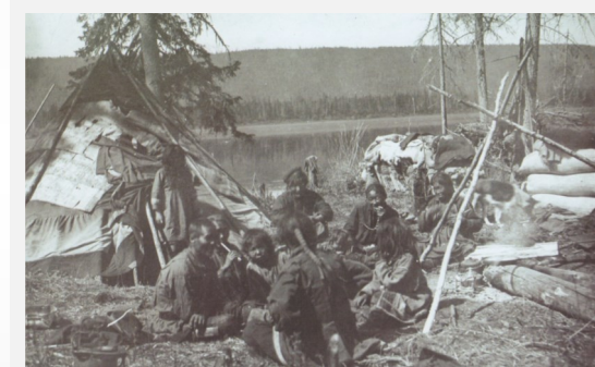
Труженики тайги приехали на устье Кочечумо «разведать новую жизнь...».