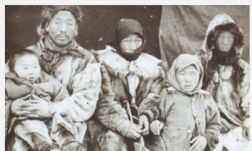
Семья эвенков на устье Кочечумо, 1925 год.