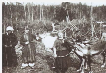
Женщины из коллектива строителей знакомятся с оленями, 1927 год.