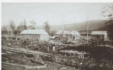
Культбаза. Интегральный кооператив «Чувакан», магазин, жилой дом, склады.