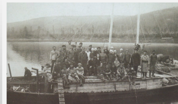
Первая илимка, прибывшая на Туринскую культбазу. Сентябрь, 1928 год.