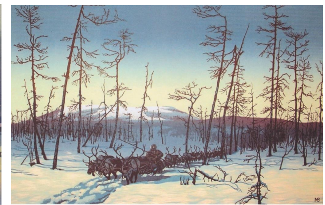
Эвенкия. Дорога на Ессей