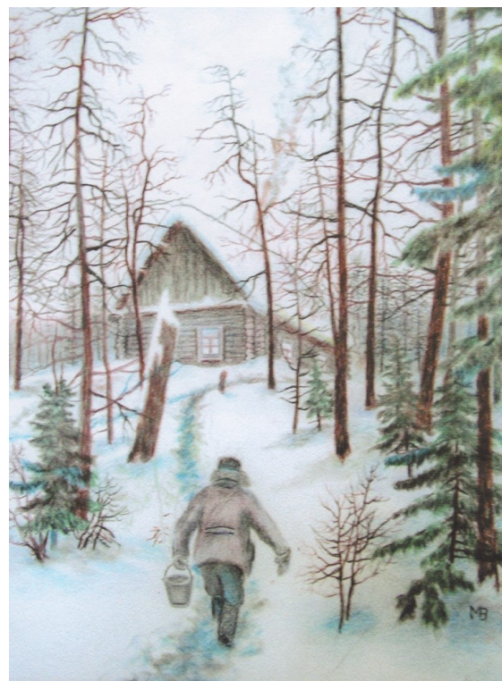
Эвенкия. Охотник на Виви