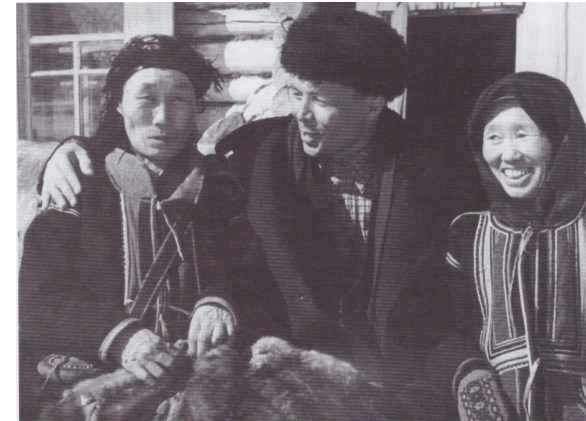
Сестры Эвенкия. Фактория Суринда, 1959 г.