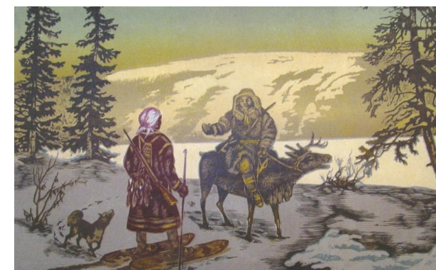
Эвенкия. Встреча на промысле