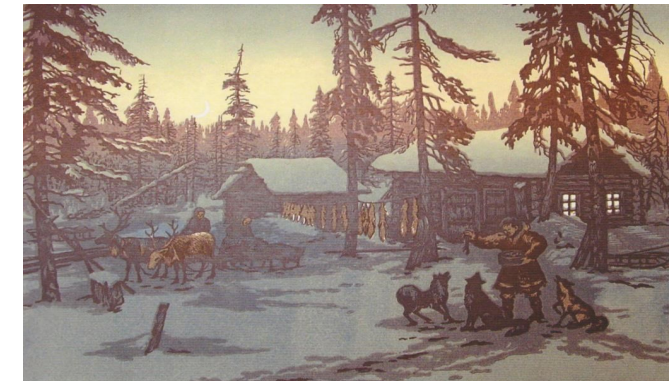
Эвенкия. Охотничья избушка